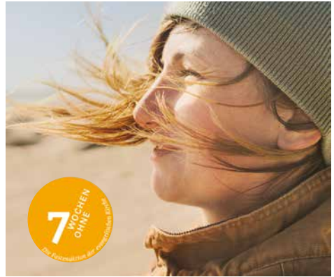
„7 Wochen Ohne/Getty Images“

Das Motto der diesjährigen Fastenaktion der Evangelischen Kirche lautet: „Luft holen! Sieben Wochen ohne Panik“ . Wir leben in atemlosen Zeiten. Gewalt und Hass machen sich breit. Wie schnell re-